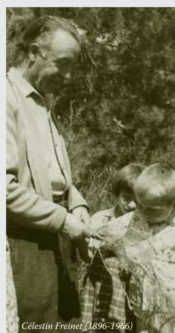
Célestin Freinet (1896-1966)

Expressie door middel van woord en beeld maken het in een klas mogelijk om moeilijk maatschappelijke thema's bespreekbaar te maken. Met projectwerking willen we dat kinderen op een creatieve en interactieve manier de eigen leefwereld (en ook de ruimere wereld) leren kennen, beleven, verder uitdiepen en in de mate van het mogelijke begrijpen en verwerken.