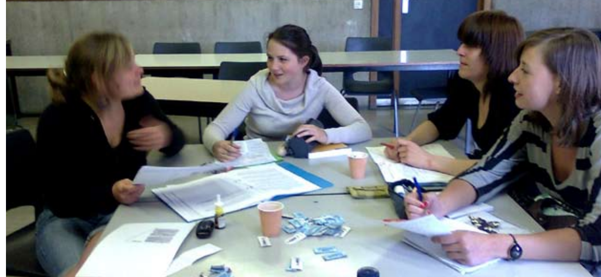
Projectonderwijs kan een losse of open structuur hebben.

Onderzoek toonde aan dat jongeren de relevantie van de leerstof voor het latere leven niet altijd inzien omdat de leerstof wordt opgesplitst in verschillende vakken, die schijnbaar geen verband houden met elkaar. Wanneer de grenzen tussen de verschillende vakken overschreden worden, kunnen de leerlingen het nut ervan voor het latere leven meer inzien. Projectonderwijs komt hieraan tegemoet (Jansen & van Kammen, 1976; De Jongh,